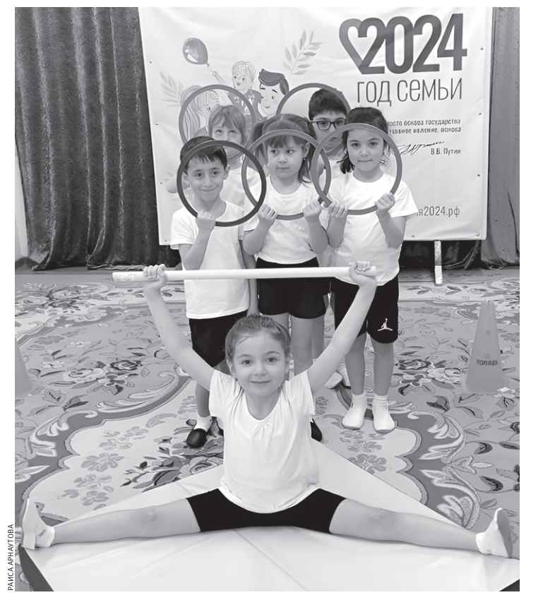
Ребята из группы «Дружная семейка» на зарядке