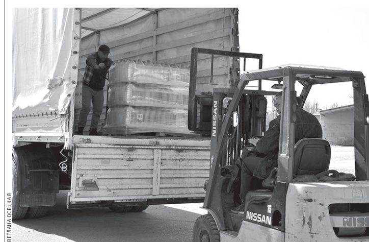
Идет погрузка питьевой воды