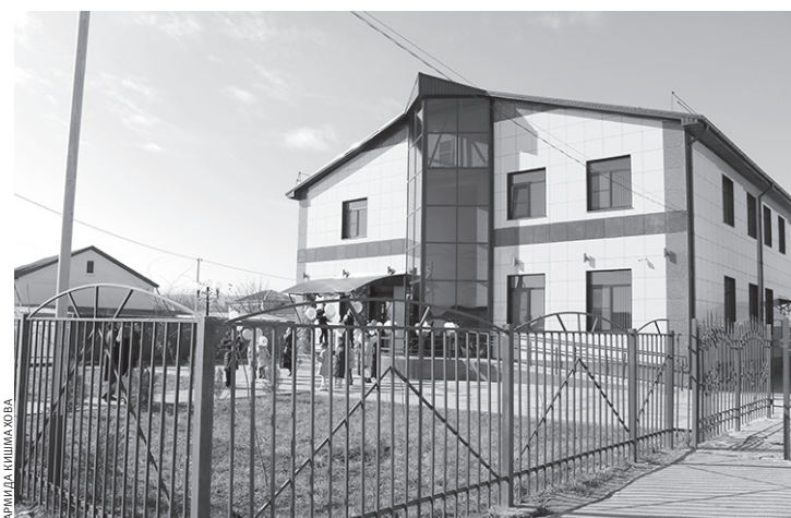
Так выглядит сегодня здание Псыжской ДШИ, в котором в прошлом году активно велся капитальный ремонт

Тема дорожного хозяйства была первой по активности обсуждения жителями района в соци-